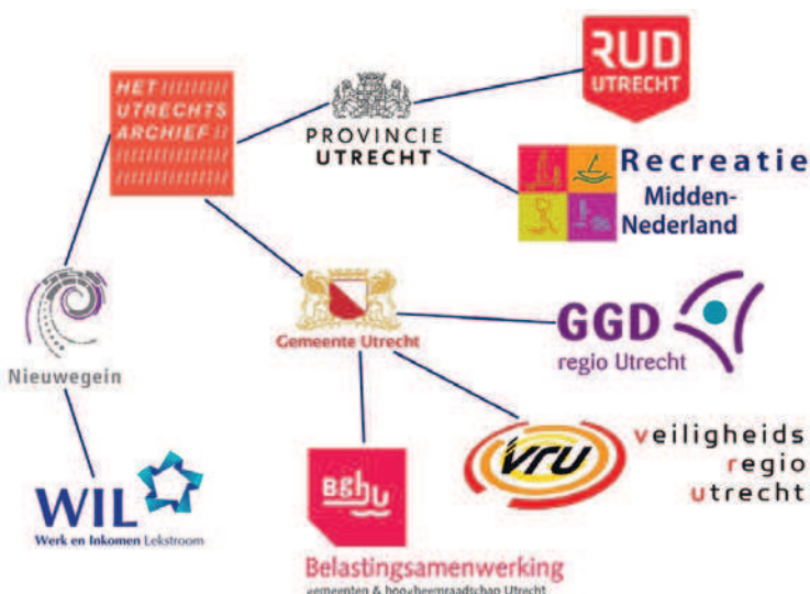
Netwerkplaat van Het Utrechts Archief, gemeente Utrecht, gemeente Nieuwegein, provincie Utrecht en gemeenschappelijke regelingen.